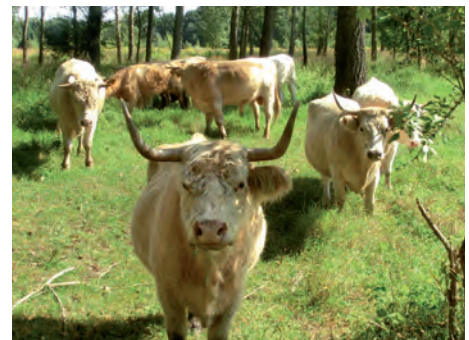
Mit den Uckermärkern auf Augenhöhe