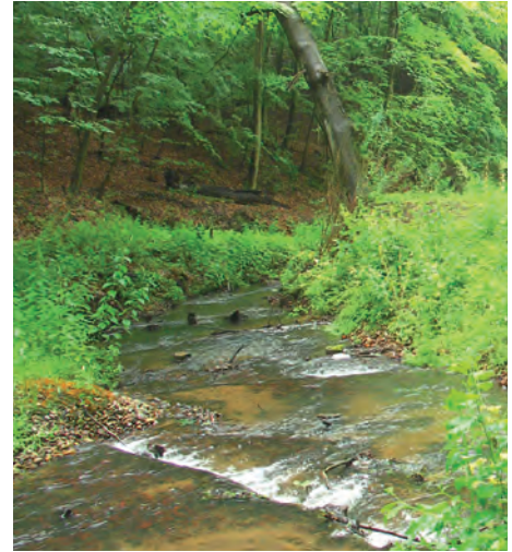
Fischtreppe am Forsthaus „Geschirr“ im Nonnenfließ

Wenn Sie die geführte Entdeckertour verpasst haben, können Sie auch auf eigene Faust losziehen! Informationen zur Lobetaler Bio-Molkerei und zu den Öffnungszeiten ihres Milchladens finden Sie auf www.lobetaler-bio.de , zum Gut Hobrechtsfelde und der Ausstellung im historischen Speicher auf www.gut-hobrechtsfelde.de .