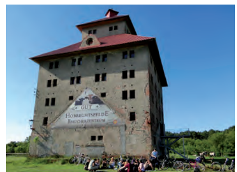
Speicher Hobrechtsfelde - herausragendes Bauwerk der Riesefeldlandschaft