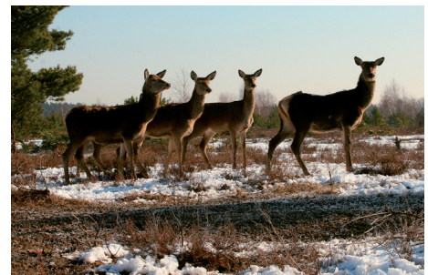
Rotwild zur Heidepflege – im Winter ist der Tisch nur dürrtig gedeckt