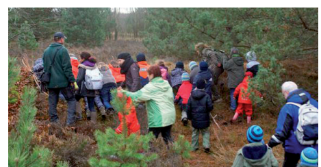
Adventswanderung 2012 - gut besucht, nur fehlte der Schnee