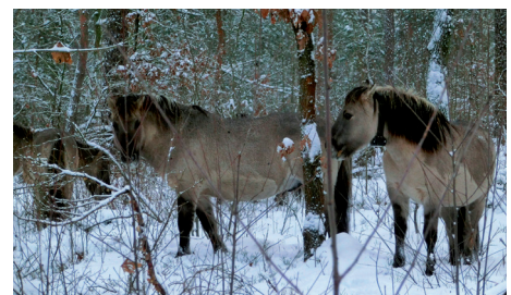
Koniks in der Schönower Heide