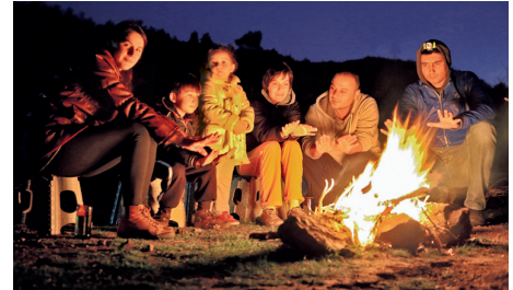
Stimmungsvoller Ausklang am Lagerfeuer

Sie können auch auf eigene Faust losziehen! Die Beschreibung der Route finden Sie auf der nächsten Seite.