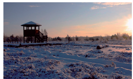
Blick auf die schneebedeckte Heide